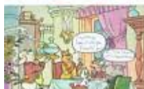
M. Toonder ABN AMRO ansichtkaarten